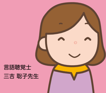
言語聴覚士 三吉 聡子先生

順序だてて話す力を育てるために、大人が子どもの話を整理しながら聞いて、話し方の見本をみせましょう