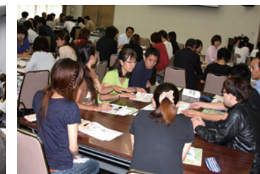
研修(グループワーク)