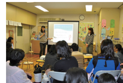
出前型ミニ講演会